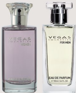
PARA ELA PARA ELE 100ML | CÓD. 100 | 28,50€

O perfume Vegas deixa uma marca pessoal praticamente inesquecível. Com as suas agradáveis notas, atua em todos os sentidos.