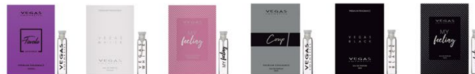
AMOSTRA | 2ML | CÓD. 9051 | 1,50€ FAVOLA COUP VEGAS WHITE VEGAS BLACK MY FEELING WOMAN MY FEELING MAN

(Acrescente o nome do perfume ao código)