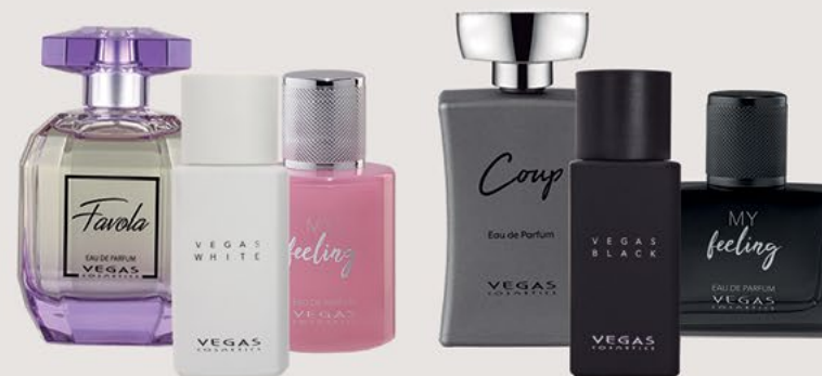
PARA ELA PARA ELE FAVOLA | 100ML | CÓD. 130 | 38,50€ COUP | 100ML | CÓD. 131 | 38,50€ VEGAS WHITE | 50ML | CÓD. 140 | 31,00€ VEGAS BLACK | 50ML | CÓD. 139 | 31,00€ MY FEELING WOMAN | 50ML | CÓD. 134 | 31,00€ MY FEELING MAN | 50ML | CÓD. 135 | 31,00€

O sutil toque das fragrâncias Premium, combinado com o poderoso sentido de olfato, têm a capacidade de marcar momentos e de tornar a vida mais completa.