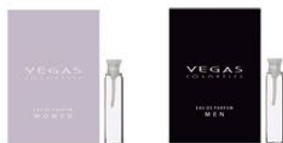
AMOSTRA | 2ML | CÓD. 9051 | 1,50€ WOMAN MAN

(Acrescente o número do perfume ao código)